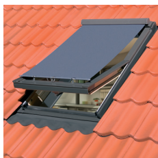
Toldo Externo AMZ