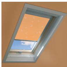
Estore ocultante ARF

O projeto da janela não permite a instalação de sistemas elétricos de abertura.