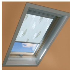
Estore interno ARP