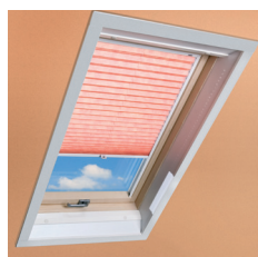
Estore Plissado APS