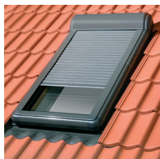
Estore externo ARZ-E