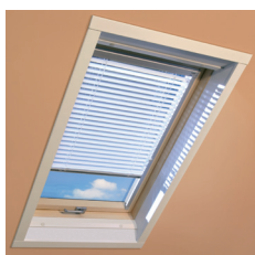
Estore veneziano AJP